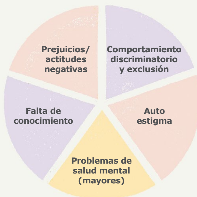
Ilustración 1: Estigmatización y Salud Mental