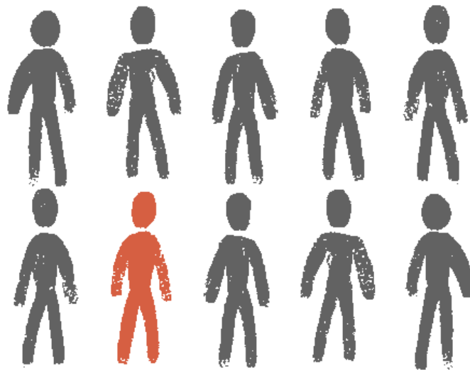
Figure 3 : Dans les pays subsahariens, seules 1 à 3 personnes sur 10 ayant des besoins en santé mentale reçoivent des soins.

Le plaidoyer de CBM vise à ce que tous les citoyens jouissent d'une bonne santé (mentale), conformément au troisième objectif de développement durable (ODD3) et aux principes d'équité, de justice et de droits fondamentaux de la personne. Cela ne peut être réalisé que si les systèmes de santé sont appréhendés de façon globale.