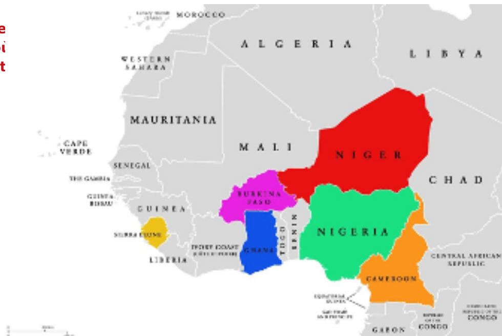
Figure 4 : Carte de l'Afrique de montrant les pays où des activités de sant

Sierra Leone : Le programme « Enabling Access to Mental Health in Sierra Leone » (Permettre l'accès à la santé mentale en Sierra Leone) – (EAMH-SL) – a été mis en œuvre par le CBM et ses partenaires (City of Rest, la Community Association for Psychosocial Services et l'Université de Makeni) pour renforcer les services de santé mentale. Le programme a également déployé des forums de santé mentale communautaire (CMHF) afin de réunir les différents intervenants et d'améliorer l'engagement communautaire en matière de santé mentale. Le projet « Building Back Better » (Mieux reconstruire) est également soutenu par CBM.